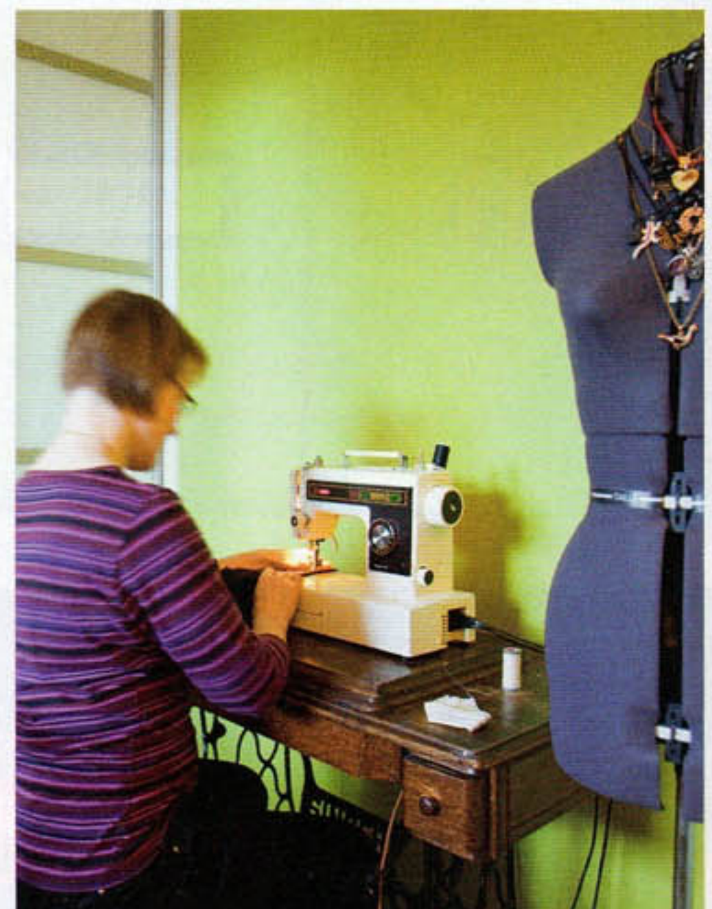
Mummon vanha ompelukonepöytä on vielä kovassa käytössä.