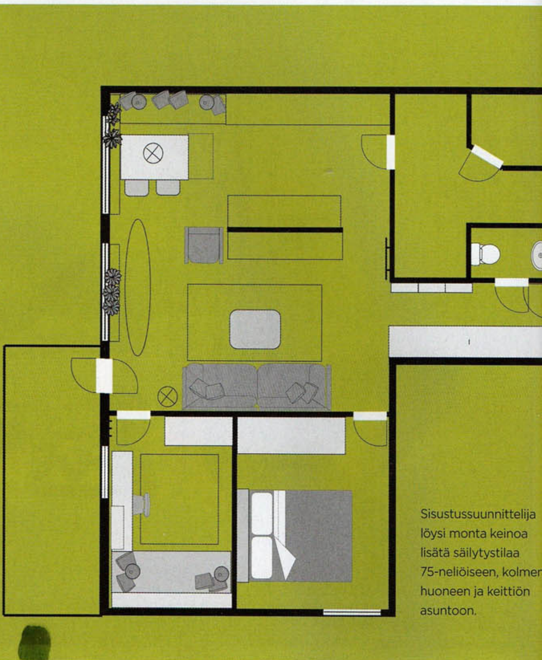
Sisustussuunnittelija löysi monta keinoa lisätä säilytystilaa 75-neliöiseen, kolmen huoneen ja keittiön asuntoon.